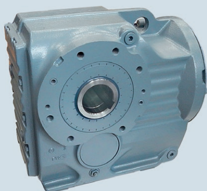
KA 87 после