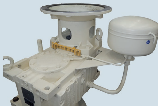
MC2 PVSF04 после