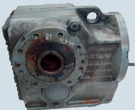
KA 87 до