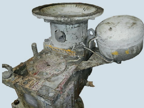
MC2 PVSF04 до